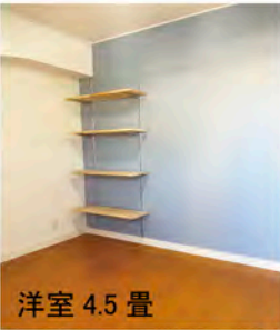
洋室 4.5 畳