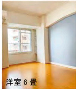
洋室 6 畳